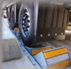
SYSTÈMES DE SÉCURITÉ