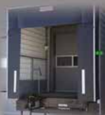
ÉQUIPEMENTS DE QUAI